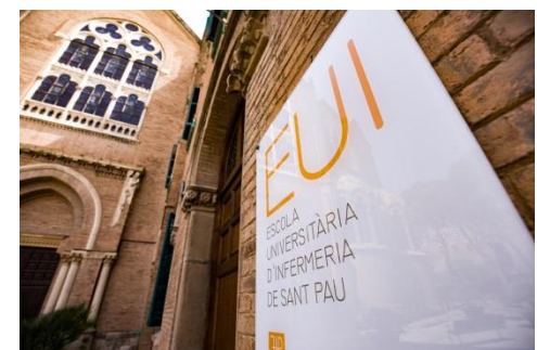
Façana EUI-Sant Pau