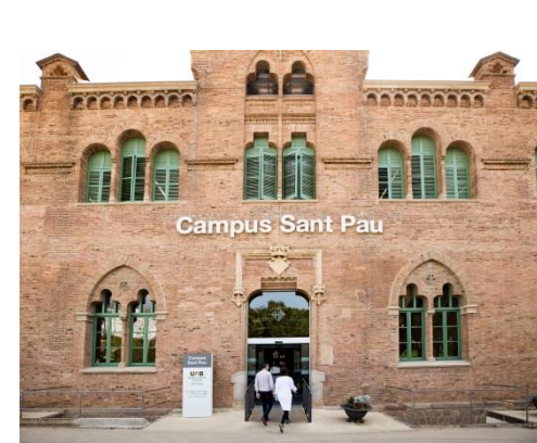
Façana Campus Sant Pau